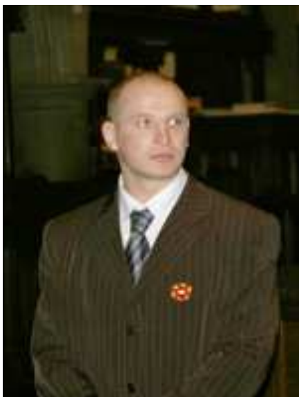
Scritorul Ionuț Caragea