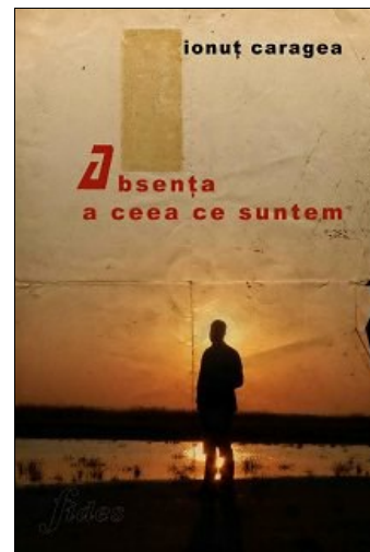
O poetică a singurătății

Poemul care dă titlul cărții, pe care o discutăm acum, poate fi socotit o altă fațetă sub care se înfățișează singurătatea, aici pluralul colectivității vizând, în fond, singurătatea ființei umane. „suntem ceea ce suntem și totuși căutăm un răspuns/ (...) tot ce atingem pare străin/ firească atingerea străin sentimentul/ nu credem că este ceva mai străin decât noi/ nu credem în fapte și totuși nimic/ din gânduri nimenicul/ nu credem în alți dumnezei în alți dumnezei nu credem/ ne doare absența a ceea ce suntem” (p. 39). De observat că ideatica acestei creații stă sub semnul lui NU – modalitate de ilustrare a înstrăinării de sine, iar afirmația din versul final este o negație întoarsă (în stil sorescian), în sensul că absența/ vidul este tot o formă de negație. Ideea aceasta o regăsim și în alte poeme: „și inima ta va rămâne/ doar un cuib părăsit” (Omul păianjen, p. 14); „să simți cuvintele toate cuvintele/ rămase pe drumuri” (Magia cuvintelor cu